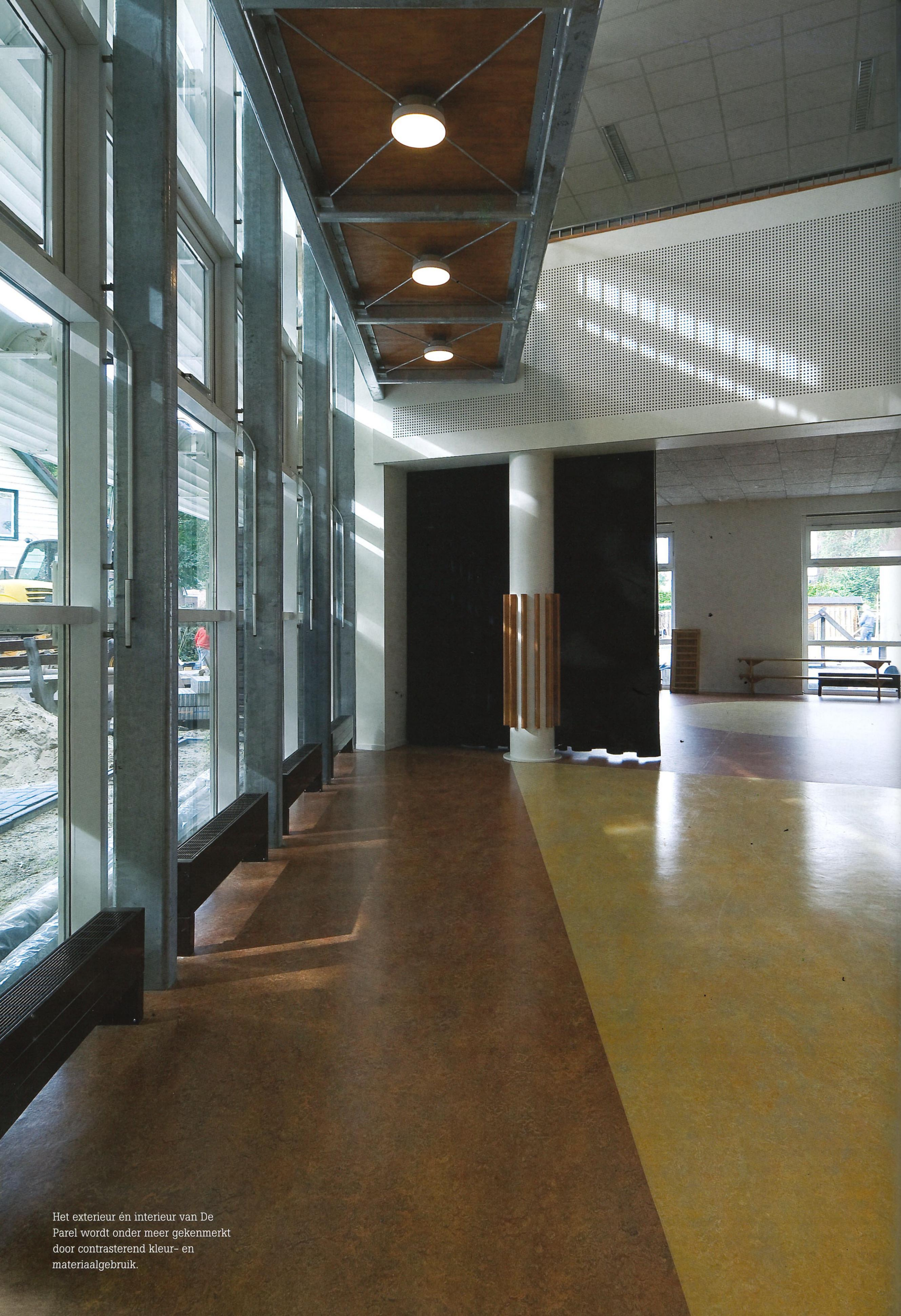
Het exterieur én interieur van De Parel wordt onder meer gekenmerkt door contrasterend kleur- en materiaalgebruik.